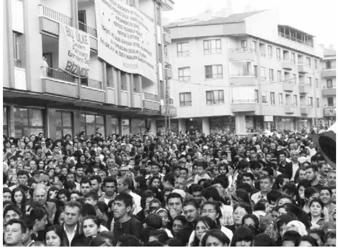
Şirintepe Halkevi Açılışı - Ankara

20. Olağan Genel Kurul'dan bu yana geçen iki yıllık süre içinde 12 yeni şube açıldı.